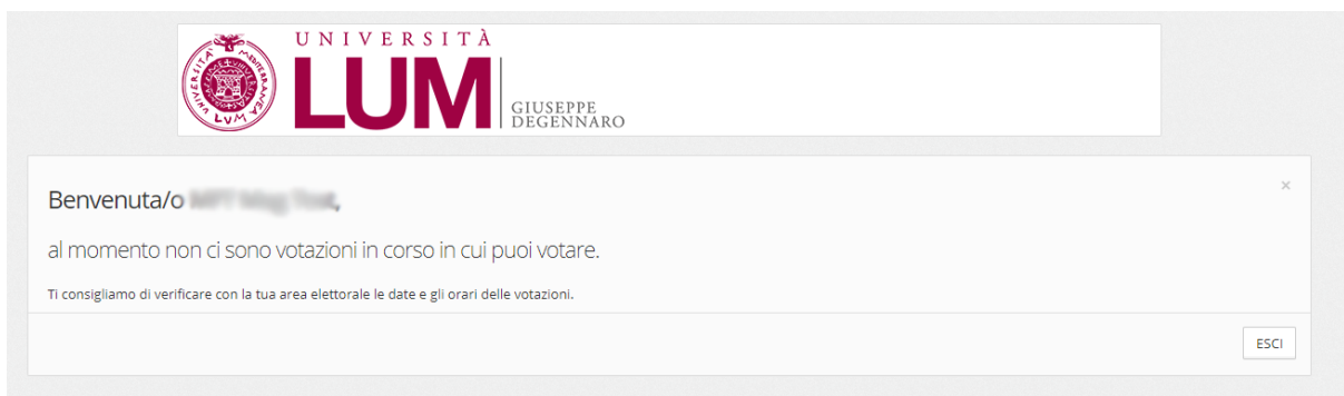
Figura E: Schermata di avviso "Nessuna votazione aperta"