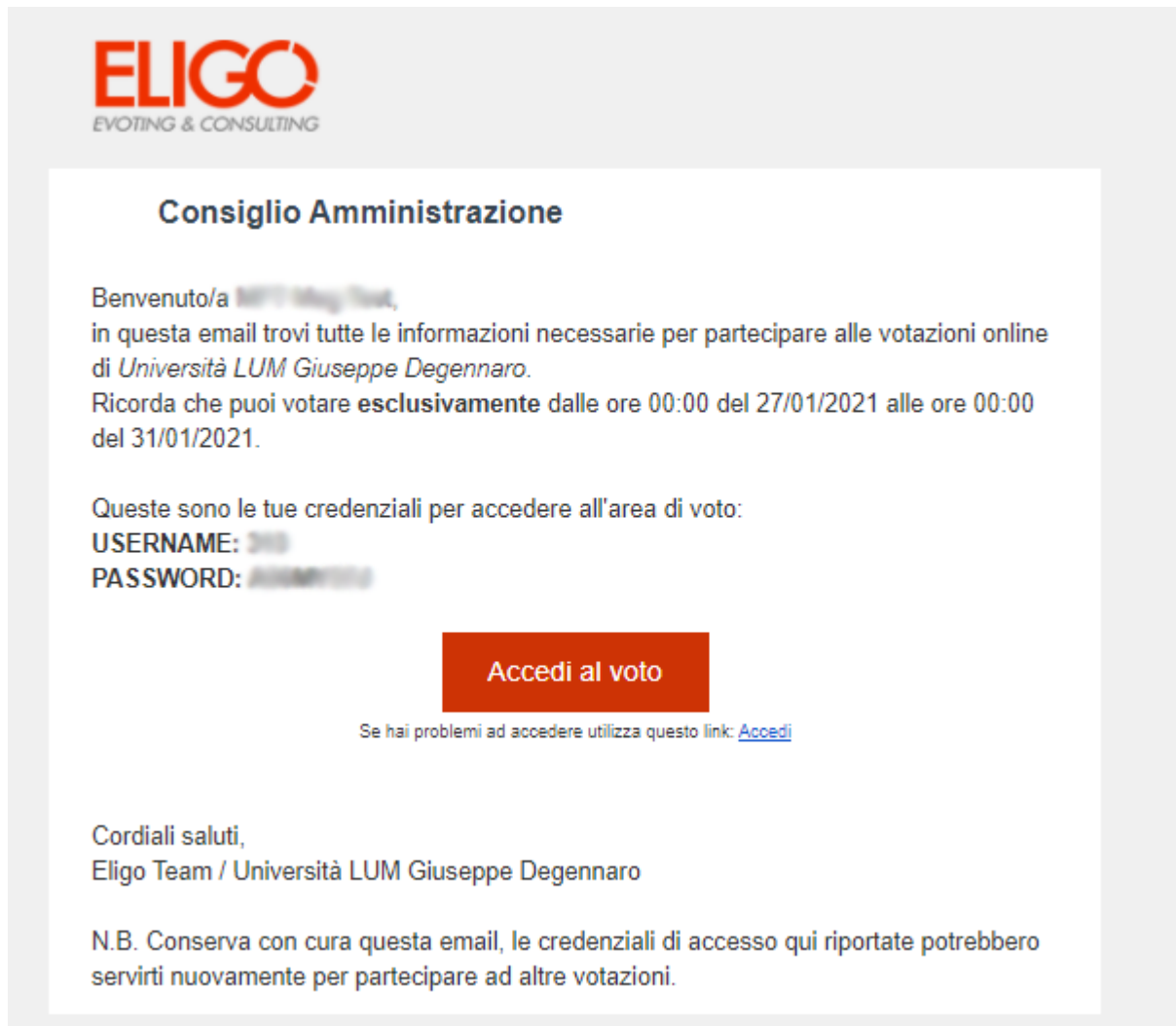
Figura A: Mail contenente le credenziali per votare